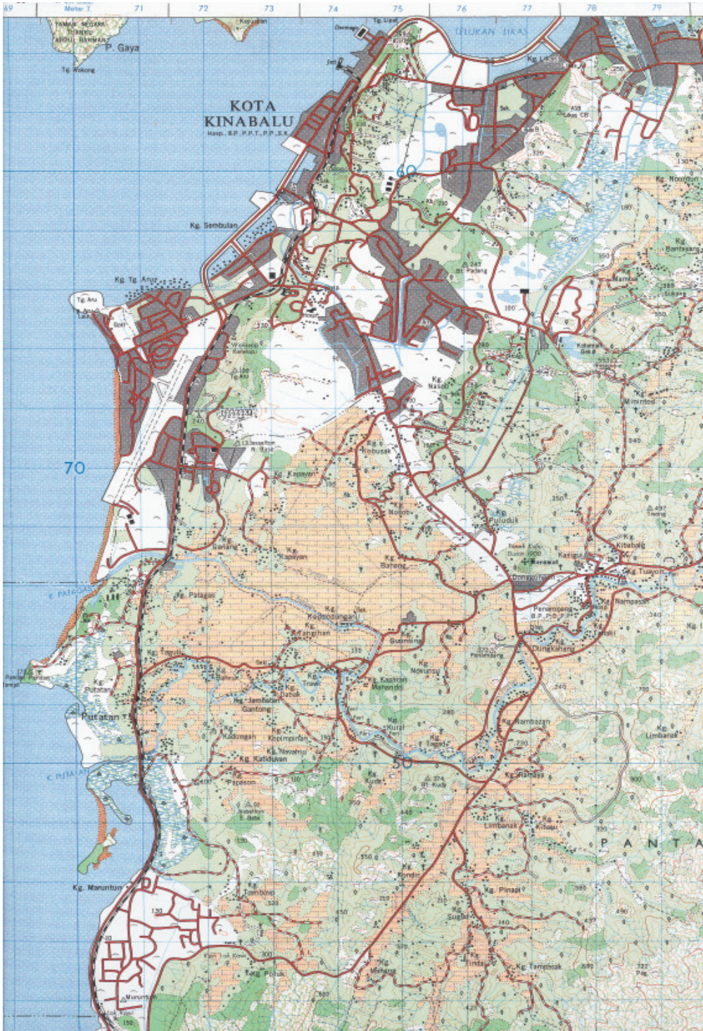
Peta 1: Kawasan Dataran Penampang: Tumpuan komuniti Kadazan khususnya kawasan sawah padi (warna kuning) dan kawasan pertanian lain (warna hijau)